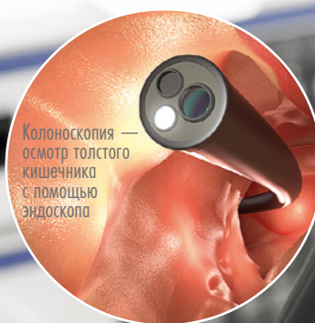
Колоноскопия — осмотр толстого кишечника с помощью эндоскопа

Для некоторых пациентов потребуется расширенная диагностика с применением комплекса лабораторных и инструментальных обследований. В частности, речь идет о людях с «тревожными признаками» — их организм может маскировать под СРК серьезные болезни, в том числе и рак. В эту группу входят пациенты старшего возраста, испытывающие постоянные болевые ощущения в животе (как единственный симптом), заметно теряющие в весе. Кроме того, звоночком для детального обследования являются кровотечения из прямой кишки, наличие скрытой крови в кале, повышение температуры тела без явной причины, анемия. Непременно нужно обратиться к врачу и людям с симптоматикой СРК, если у их ближайших родственников были выявлены болезни Крона, язвенный колит, колоректальный рак или целиакия — патологическое нарушение работы кишечника, при котором наблюдается непереносимость глютена.